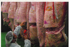
グランドチャンピオン牛の他に 匹敵する優良入賞牛を 多数落札いたしました