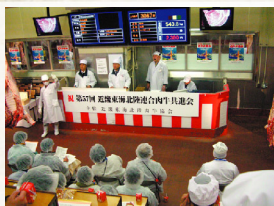
日本三大銘柄牛が一堂に会する様は さながら、肉牛の「甲子園」