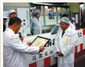
表彰を受ける弊社社長