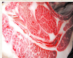
ダイナミックかつ繊細な霜降り具合